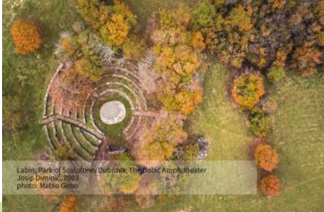
Labin, Park of Sculptures, Dubrovnik, The Bolac Amphitheater Jozip Dimic, 2005