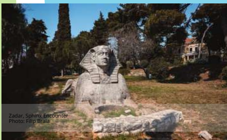
Zadar, Sphinx, Encounter