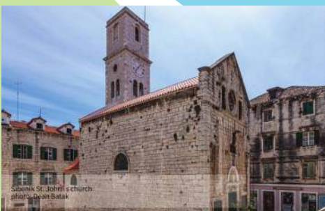
Šibenik St. John's church