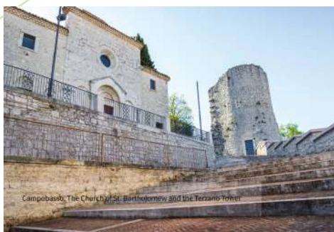
Campobasso, The Church of St. Bartholomew and the Terzano Tower