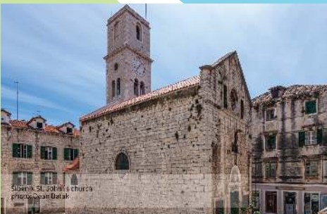
Šibenik, St. John's church