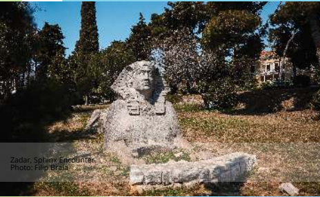
Zadar, Sphinx Eneideum

Znete li ljubavnu priču koja se veže uz najveću sfinxu u Europi? Jeste li ikada bili dio krajolika Montefeltra koji su prikazani na slavnim renesansnim slikama? Biste li voljeli riješiti misterij keltskog hipogeuma u Cividale del Friuli-u ili možda preferirate piknik u labinskom Parku skulptura? : Jeste li se ikada zaputili u Šibenik kako biste se prepustili čarobnoj atmosferi njegovog starog grada? Možda vas ipak najviše od svega privlači mitološki grad Aquilonia na planini Monte Vairano?