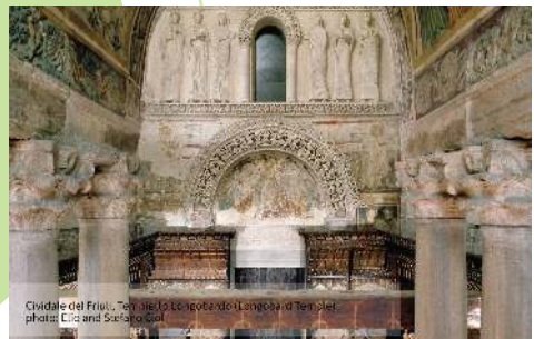
Cividale del Friuli, Temple of Longobardi (Langobard Temple)