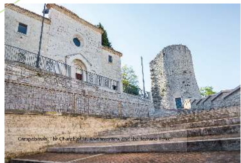
Canapiana, St. Martin's church and the tower tower