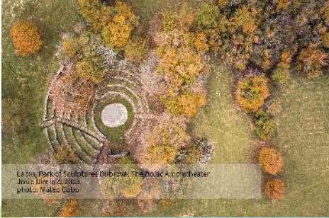
Labina Park of Sculptures (Istria) - The Dolac Amphitheater 1942, 1943, 1944, 2002, 2003

Znete li ljubavnu priču koja se veže uz najveću sfinxu u Europi? Jeste li ikada bili dio krajolika Montefeltra koji su prikazani na slavnim renesansnim slikama? Biste li voljeli riješiti misterij keltskog hipogeuma u Cividale del Friuli-u ili možda preferirate piknik u labinskom Parku skulptura? : Jeste li se ikada zaputili u Šibenik kako biste se prepustili čarobnoj atmosferi njegovog starog grada? Možda vas ipak najviše od svega privlači mitološki grad Aquilonia na planini Monte Vairano?